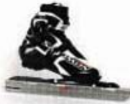
S-Lab Skate Pro Marathon MPS Setprijs 395,- 299,- 694,-