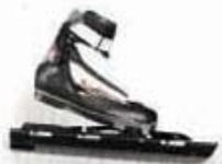
Vitane Combi Pilot Marathon MPS Setprijs 189,- 299,- 488,-