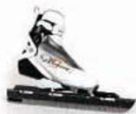
Vitane Carbon Marathon MPS Setprijs 259,- 299,- 558,-