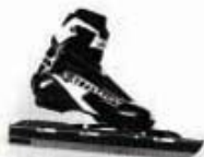
S-Lab Skate Marathon MPS Setprijs 319,- 299,- 618,-