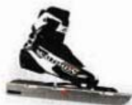
Pro Combi Pilot Marathon MPS Setprijs 189,- 299,- 488,-

Met een zowel in de lengterichting als zijwaarts eenvoudig verstelbare binding