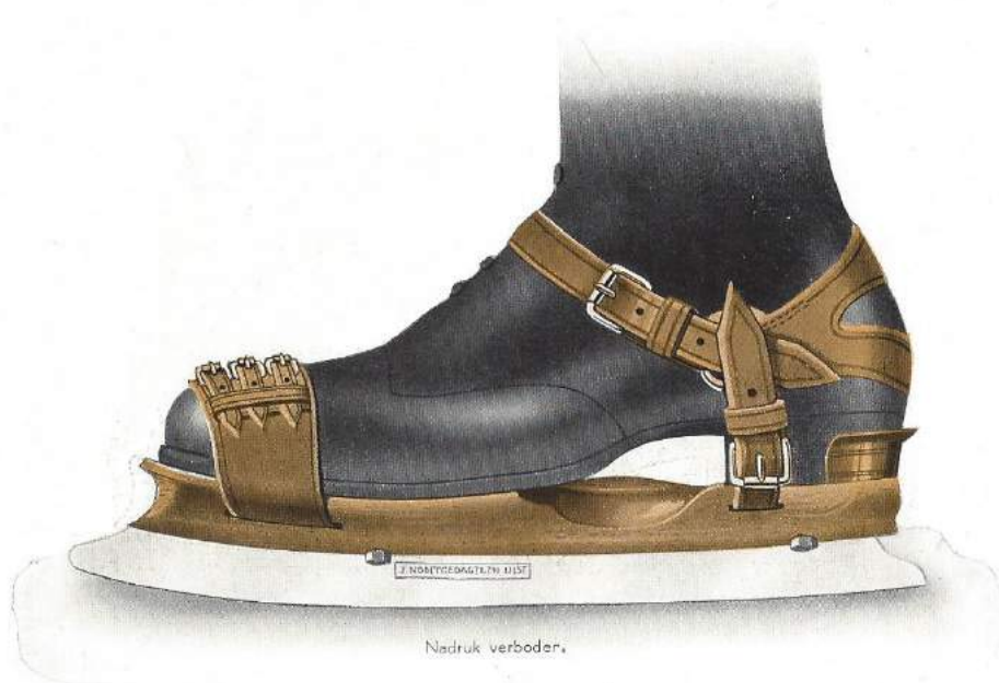
No. 8 b . FIJNE KUNSTSCHAATS.

J. NOOITGEDAGT & ZONEN — SCHAATSENFABRIKANTEN — IJLST