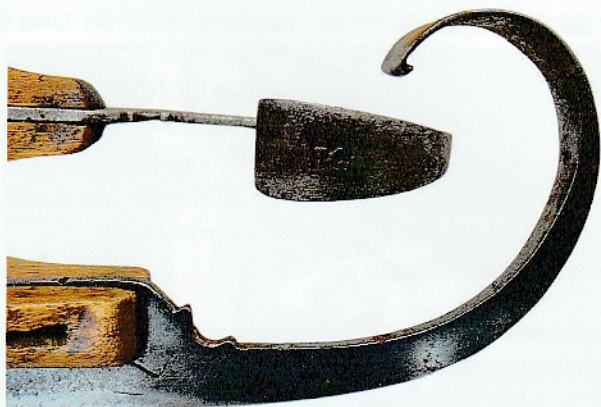
Afb. 03 De afgeplatte krul van de Nieuwkoopse schaatsen.

De in Nieuwkoop gemaakte krulschaats (afb. 2) heeft aan de achterzijde bij de hak een kort ijzer dat schenkel wordt genoemd. Dit woord verwijst naar de schenkels van paarden of runderen, waar de eerste schaatsen van worden gemaakt. Volgens het klassieke Woordenboek der Nederlandsche Taal wordt dit plaatselijk gedaan en men noemt 'o.a. Mijdrecht (Den Hoef)', maar in het gehele land is het gebruikelijk om botten van dieren te gebruiken. Aan de voorzijde loopt het ijzer van