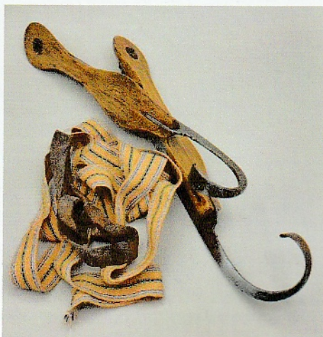
Afb. 06 De krukschaatsen met bindingen.