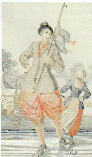
Afb. 01 Schaatsende man en meisje. Pieter van den Berge, 1695 - 1697. Rijksmuseum Amsterdam RP-P-1890-A-15891.

De krulschaats met zijn veelal uitbundige en sierlijke krullen, is een veelgebruikt model en komt al in de zeventiende en achttiende eeuw voor. De Linschoter krulschaats heeft een relatief kleine krul die verkleind en verlaagd wordt om betere resultaten te geven tijdens het schaatsen. Door de schenkel in de juiste ronding te slijpen kan de Linschoter krulschaats gebruikt worden voor zowel hardrijden, schoonrijden als toertochten. Deze schaats wordt in eerste instantie in het Utrechtse dorp Linschoten door lokale smeden gemaakt. De Linschoter krulschaats is in de negentiende eeuw het meest gebruikte type schaats en wordt door de enorme populariteit ook in andere plaatsen vervaardigd. Hij wordt in verschillende varianten gemaakt en mogelijk zijn er per regio specifieke verschillen aangebracht. Aan het eind van de negentiende eeuw loopt de populariteit van de Linschoter schaats terug, mede omdat de krul te gevaarlijk gevonden wordt. Kennelijk blijft men nogal eens haken waardoor op de ijsbanen ongelukken ontstaan. Rond 1900 worden de krulschaatsen nog maar mondjesmaat vervaardigd.