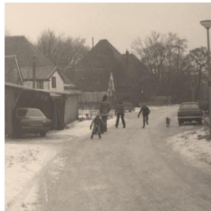
Van Achtersloot .....tot Achtergraft