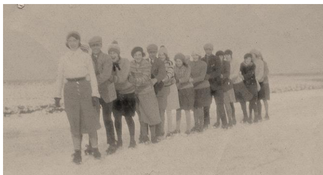
Schaatsen op de Veersloot in 1931

Ook namens het district Alkmaar werd de afdeling Koedijk geluk gewenst, waarna burgemeester