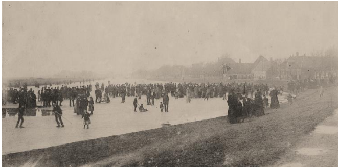
IJspret op het Kanaal in 1926

Volgens hem bestaat er de laatste jaren geen enkele samenwerking meer tussen bond en club.