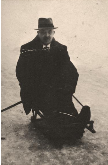
Ook de dokter verplaatste zich per prikslede

In 1946 organiseerde de IJclub Koedijk de Geestmerambachttocht. De route ging van Koedijk naar Sint Pancras, langs de Zomersloot, naar Warmenhuizen en terug langs de Diepsmeer naar Koedijk.